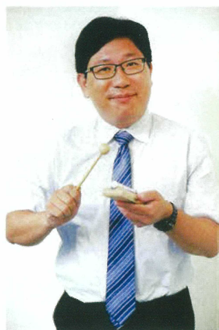
陳校長相信，人「靜而後能安，安而後能動慮，慮而後能得」，心靜才不會妄動，才能思慮周詳，然後達到至善境界。