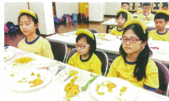
以遊戲形式加入呼吸、靜思等練習，就好像在果藝課中頂着香蕉靜坐，才能引起小孩興趣及體會靜觀道理。